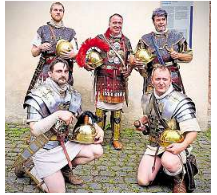
Historische Darsteller lassen die Stenweiler Ortsgeschichte lebendig werden.

Die große Auftaktveranstaltung startet dabei am 24. Juli, dem ersten Sonntag in den Ferien, dem. Ab 14 Uhr bevölkern dabei historische Darsteller in authentischer Gewandung den Rallye-Weg. Stilsicher verkörpern sie die unterschiedlichen Epochen der Geschichte Stenweilers und geben den Teilnehmern einen lebendigen Einblick in das Leben des Ortes in längst vergangenen Zeiten. Die Idee der Rallye ist ebenso einfach, wie faszinierend: Mit der speziell dafür ausgearbeiteten und bunt bebilderten Rallyemappe sowie mit Wegekarte ausgestattet ziehen die Teilnehmer los, um in den Straßen, We-